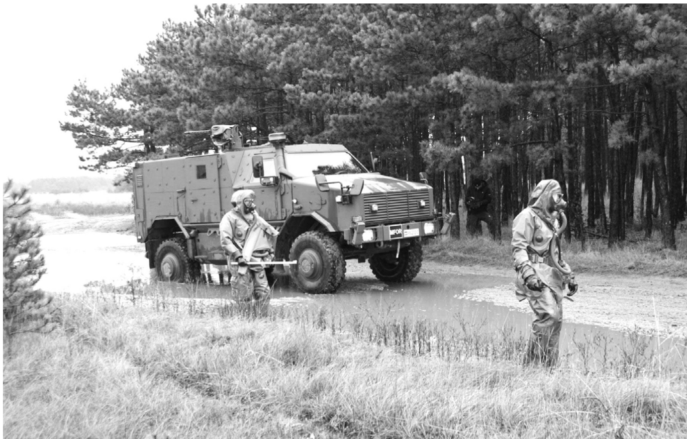
Bild: Zuständig bei Bedrohung mit CBRN-Stoffen ist die ABC-Abwehrtruppe des Österreichischen Bundesheers.

Caroline Wörgötter, Abteilung Abrüstung, Rüstungskontrolle und Nichtweiterverbreitung im Bundesministerium für Europäische und Internationale Angelegenheiten