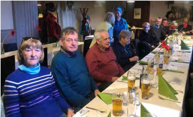
▲ Gemütliches Beisammensein im Gasthof Handler in Dörfles.