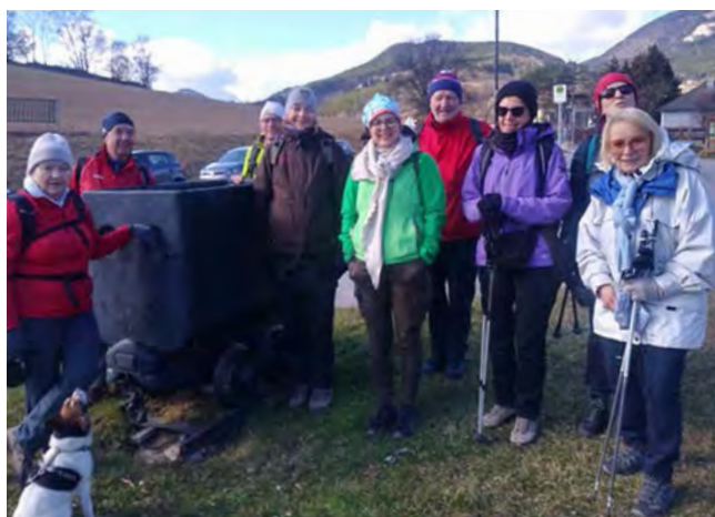
▲ Die Wandergruppe vor dem Zweierwald.