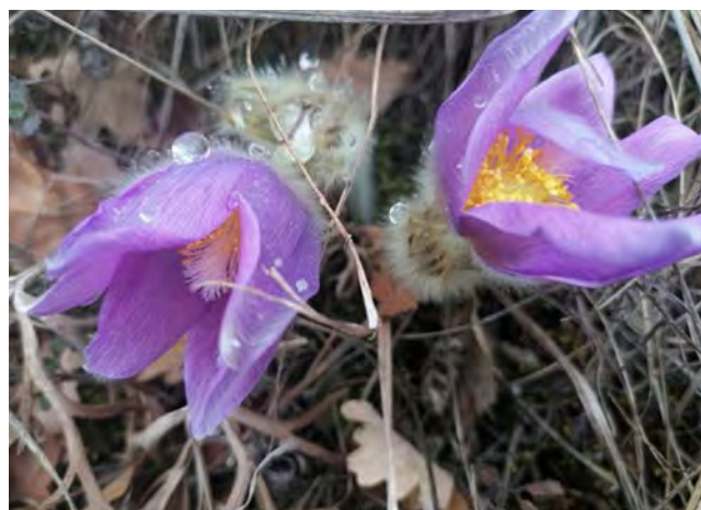
▲ Auf dem Blosenberg entfalten die Kuhschellen ihre Pracht