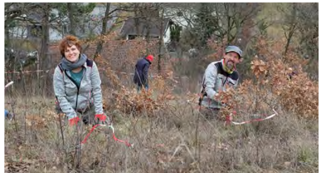
◀ ▲ Naturfreunde bei der Blosenberg-Pflegeaktion gemeinsam mit dem Landschaftspflegeverein Thermenlinie.