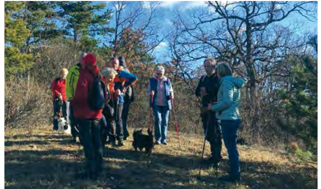
▲ Herrlicher Ausblick vom Mitterberg in die Neue Welt.