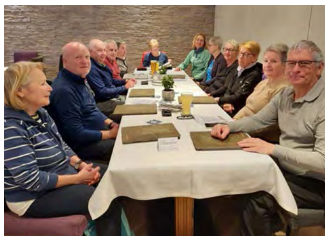
▲ Müde, aber voller schöner Eindrücke: Mittagessen beim Jautschnig am Kirchbühel.