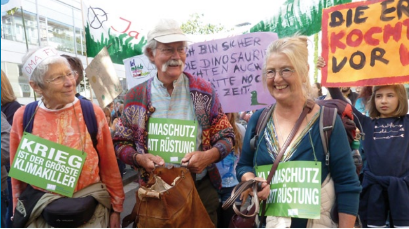
Massenhafter Klimaprotest